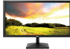
22-24인치 TV 모니터

HDTV 전원코드,오디오케이블,VGA,DVI, HDMI, 1366 X 768 스피커 2W X 2 AC 100-240, 50/60 Hz 1.8 kg 22인치TV 2.2 kg 24인치TV HDMI-CEC 기능